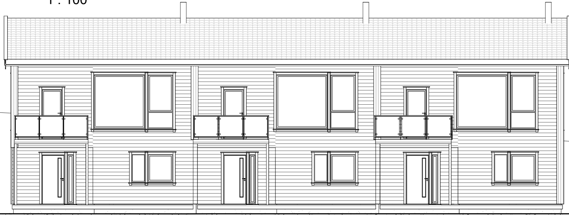
Øst 1 : 100