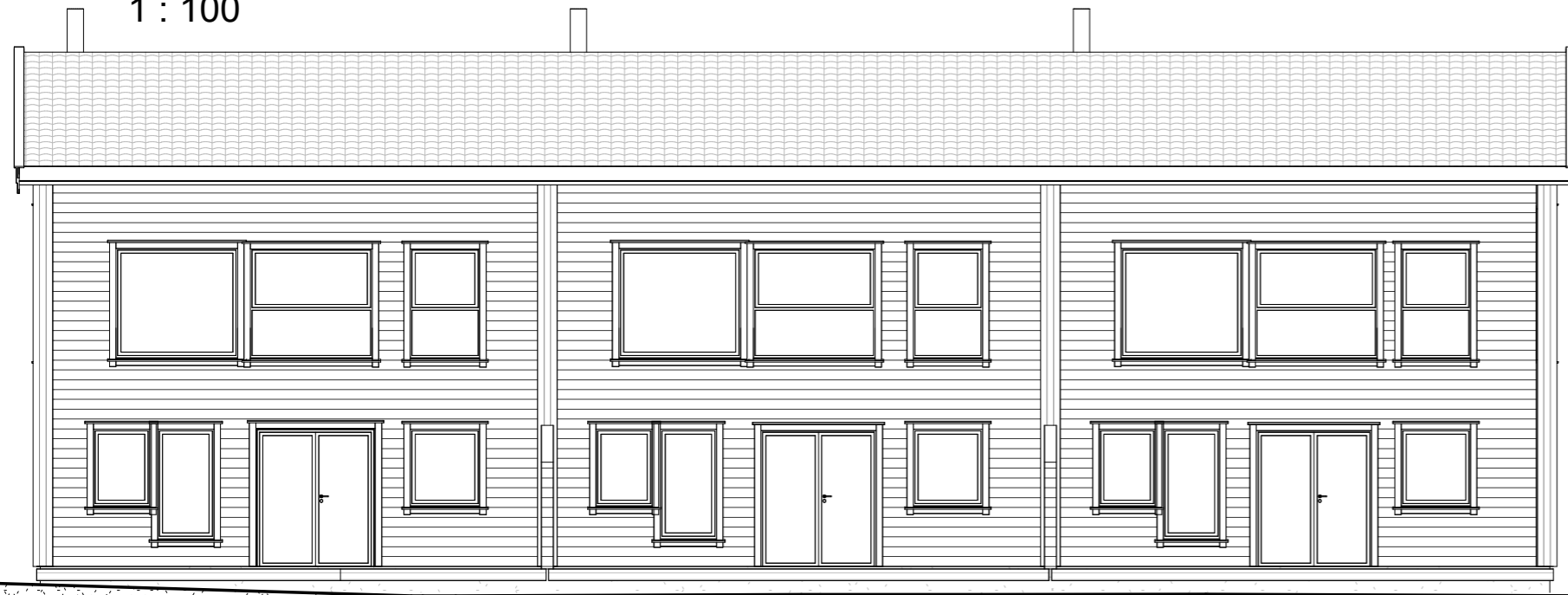
Vest 1 : 100